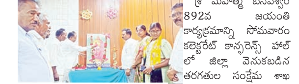
పుష్పాంజలి ఘటిస్తున్న ఎమ్మెల్యే గండ్ర

ప్రభాతవార్త ప్రతినీధి - జయశంకర్ భూపాలపల్లి బ్యారో