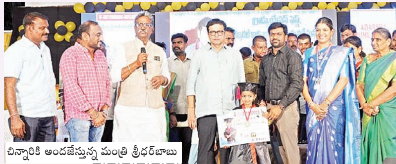
చిన్నారుకి అందజేస్తున్న మంత్రి శ్రీధర్ బాబు

అన్నారు. మండల కేంద్రంలోని ఆదర్శ హైస్కూల్ లో ఆదివారం రాత్రి నిర్వహించిన 36వ వార్షికోత్సవ, గ్రామీణ యేషన్ ఫెస్టివల్ కార్యక్రమాల వేడుకలకు మంత్రి ముఖ్య అతిథిగా హాజరై విద్యార్థులను అభినందించారు. 36వ వార్షికోత్సవ ప్రాంతంలో ఆదర్శ విద్యా సంస్థ అందిస్తున్న సేవలను అభినందించి, పలువురు విద్యార్థులకు గ్రామీణ యేషన్ సర్టిఫికేట్స్, మెడల్స్ ను అందజేశారు.