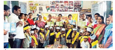
స్త్రీ స్కూల్ అసెస్మెంట్ కార్డులను ప్రదర్శిస్తున్న దృశ్యం

సేవలను పూర్తిగా ఉపయోగించుకోవాలని కూడా సూచించారు. ప్రతి గర్భిణీ స్త్రీ రక్షహీనత నుండి దూరంగా ఉండాలని, పౌష్టికాహారంతో పాటు ఐరన్, కాల్షియం మాత్రలు క్రమం తప్పకుండా వాడి ఆరోగ్యవంతమైన శిశువును జన్మించేలా జాగ్రత్త పడాలని సూచనలు చేశారు. అలాగే ప్రతి కిషోర బాలిక కూడా అంగన్ వాడీలో ఇచ్చే ఇనుము గుళికలను నిరంతరం వాడి రక్షహీనతను నివారించుకోవాలని వివరించారు. స్థానిక ఆహార పదార్థాలు, చిరుధాన్యాల ఉపయోగంతో పౌష్టికమైన వంటకాలను ఎలా తయారు చేయాలో తల్లిదండ్రులకు ప్రాక్టికల్ గా అవగాహన కల్పించారు. జంక్ ఫుడ్, ప్యాకెట్ ఆహారం వలన కలిగే అధిక నష్టం, పౌష్టికాహార లోపం, దీర్ఘకాలిక అనారోగ్య సమస్యలపై హెచ్చరిస్తూ స్వచ్ఛమైన, స్థానిక పదార్థాలపై దృష్టి పెట్టాలని స్పష్టంగా చెప్పారు. షిఫ్ట్ ఎన్ ఎన్ డి సమయంలో పిల్లల అభివృద్ధి