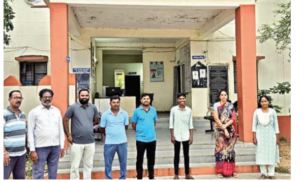
అరెస్ట్ అయిన ప్రజాసంఘాల నాయకులు