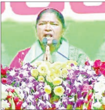
అన్నారు. మహిళల మనోభావాలను దెబ్బతీసినందుకు వెంటనే మాజీ సీఎం కేసీఆర్ క్షమాపణ చెప్పాలని డిమాండ్ చేశారు.

ములుగు జిల్లా క్రైమ్ బ్యూరో ప్రభాత వార్త. ఉచిత బస్సు ప్రయాణ పథకంపై మాజీ సీఎం చేసిన వ్యాఖ్యలను మంత్రి సీతక్క తీవ్రంగా ఖండించారు. ఈ వ్యాఖ్యలు మహిళల గౌరవాన్ని దెబ్బతీసేలా ఉన్నాయని ఆమె ఆగ్రహం వ్యక్తం చేశారు. ప్రీ బస్ పథకాన్ని పనికొచ్చినదిగా అభివర్ణించడం దోరతనపు ధోరణికి నిదర్శనమని మండిపడ్డారు. వెంటనే ఆ వ్యాఖ్యలను ఉపసంహరించుకోవాలని డిమాండ్ చేశారు. పథకం పనికొరచిన భావిస్తే, దాన్ని రద్దు చేస్తామని చెప్పే ధైర్యం ఉందా అని సవాల్ విసిరారు. ఈ పథకం వల్ల లక్షలాది మహిళలు ప్రతిరోజూ ప్రయాణ ఖర్చులు అదా చేసుకుంటూ ఉద్యోగాలు, విద్య, వైద్య సేవలను సులభంగా పొందుతున్నారని తెలిపారు. ఇప్పటివరకు దాదాపు రూ.10 వేల కోట్ల మేర